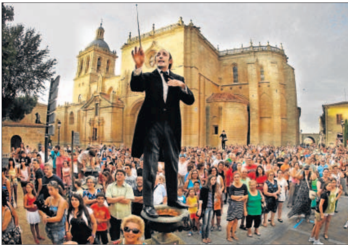
El público sigue una de las actuaciones de los espectáculos de calle de la pasada edición de la Feria de Teatro.

Entre las condiciones para inscribirse y poder participar en la próxima edición del escaparate teatral mirobrigense, se aceptarán exclusivamente trabajos estrenados a lo largo del 2012 y 2013, o trabajos internacionales no estrenados en España; y se valorarán muy positivamente la propuestas de estreno en la Feria, tanto estrenos absolutos como estrenos en castellano, siempre que el comité de selección, cuya composición se dará a conocer en su día, tenga el tiempo suficiente de recabar datos